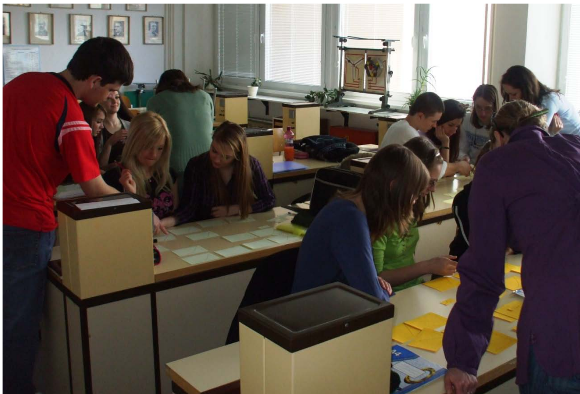
Obr. 3: Atmosféra v triede pri overovaní hry Kreslené pohyby

Následne sme testovali navrhnuté hry v rámci pedagogickej praxe v I. C triede Gymnázia Andreja Sládkoviča v Banskej Bystrici (obr. 3). Na hodine fyziky sme overili tri hry – Bingo, Kreslené pohyby a Dynamické domino.