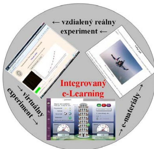
Obr. 1 Stratégia Integrovaný e-Learning

meraní si importovať získané dáta do svojho počítača [5]. Reálne vzdialené experimenty fungujú v e-laboratóriách, pričom niektoré z nich sú voľne prístupné všetkým užívateľom [6, 7, 8], čo umožňuje ich zakomponovanie do výučby. Na Slovensku už funguje prvé e-laboratórium [9] na Katedre fyziky Trnavskej univerzity a v súčasnosti ponúka užívateľom štyri fyzikálne a jeden chemický experiment – kf.truni.sk/remotelab.