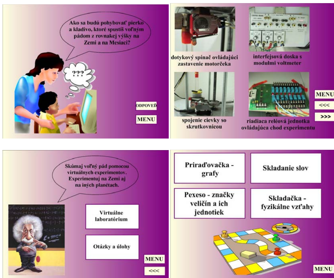
Obr. 3 Ukážky z INTe-L súboru – motivácia, fotogaléria, virtuálny experiment a hry

E-študijný materiál je pdf dokument vytvorený pre potreby tohto balíčka a obsahuje motivačné otázky, základnú teóriu, príklad skúmania voľného pádu v laboratórnych podmienkach a vzorový príklad s numerickým a grafickým riešením. V teórii zdôrazňujeme skutočnosť, že voľný pád je pohyb rovnomerne zrýchlený. Študenti by si tak mali uvedomiť, že vzťahy pre oba pohyby sú vo svojej podstate rovnaké a preto nie je nutné učiť sa ich ako dva nové vzťahy (ako sa stáva v mnohých prípadoch).