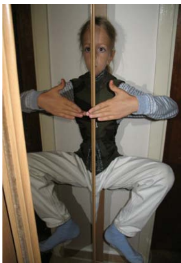
Obr. 5: Optické klamy

Ak svetlo prechádza z opticky hustejšieho prostredia do opticky redšieho, môže nastať tzv. totálny odraz svetla , a to pre uhly dopadu väčšie alebo rovné medznému uhlu. Tento princíp sa využíva v optických kábloch, svetlovodoch . Základný optický prvok je tvorený skleneným vláknom z veľmi čistého skla, obklopený sklom menšej hustoty. Vďaka tomu sa svetlo šíri len vnútorným skleneným vláknom a to mnohonásobnými úplnými odrazmi na rozhraniach so sklom menšej hustoty. Takéto šírenie svetla je možné na veľké vzdialenosti takmer bez strát.