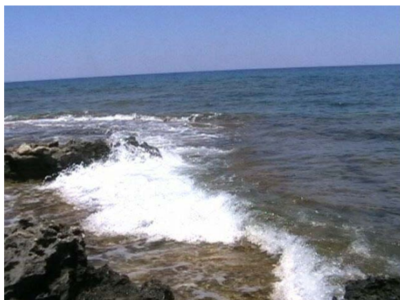
Obr. 4: Morská pena – difúzny odraz

Hovoríme o difúznom odraze . Preto sa sneh, morská pena (obr. 4), či roztlčený ľad javí ako biely, nepriehľadný, aj keď pozostáva z priehľadných bezfarebných kryštálov.