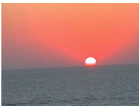
Obr. 1: Východ Slnka

Videofilm „Naše Slnko“ začína východom Slnka (obr. 1) a vysvetlením Rayleighovho rozptylu , ktorý je príčinou toho, že východ a západ Slnka vnímame červenou farbou. Keď slnečné svetlo dosiahne atmosféru Zeme nastáva interakcia svetelných vln s molekulami vzduchu, prachu, s vodnou parou.