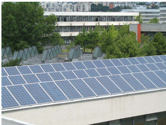
Obr. 3: Solárne články na streche FMFI UK

Najviac tepelnej energie zo Slnka dostávame vo forme infračerveného žiarenia, ktoré je oblakmi málo pohlcované. V súčasnosti sa využívajú rôzne solárne články (obr. 3) na využitie tejto energie. Vo filme sú zachytené rôzne solárne články využiteľné napríklad na ohrev vody a celé solárne batérie, ktoré premieňajú túto energiu na elektrickú energiu.